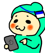
(a) このメールに再度空メールで返信します