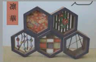
▲ものデザインコンテスト クラフト部門 優秀賞