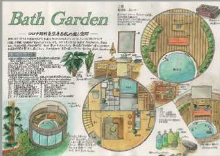
▲お風呂コベ屋様選都大学 第三回高校生インテリアデザインコンクール 優秀賞 (2年生実習 製図コベ作品)