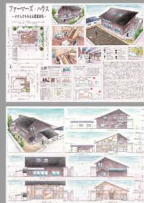
▲日本建築学会卒業設計 入賞 (3年生実習 製図)

▼毎日・DAS 学生デザイン賞 高校生デザイン賞 銀の卵賞 / クラフト部門賞 / ファッション&テキスタイル部門賞