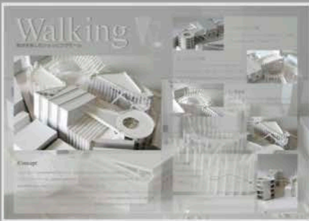
▲卒業設計 模型 (3年生実習 製図)