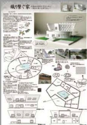
▲毎日・DAS 学生デザイン賞 高校生デザイン賞 入選 (2年生実習 製図)