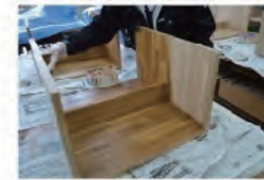
③書架ユニット制作