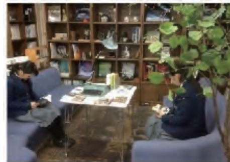
④新しい閲覧空間の創作