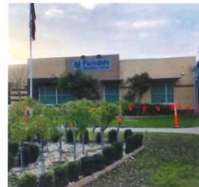
パークデール高校 オーストラリア ビクトリア州 メルボルン市