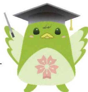
公式キャラクター さくたくん

桜和高校は大阪教育大学など大阪周辺にある多くの大学と連携を進めています。大学の先生から授業を受けたり、大学生・院生や留学生と交流したりする機会があります。