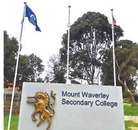
マウント・ウェーバリー高校 オーストラリア ビクトリア州 メルボルン市