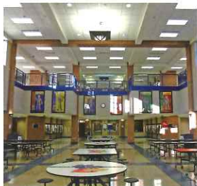
アーバンデール高校 アメリカ アイオワ州 デモイン市

桜和高校には3つの姉妹校があり、 希望者がホームステイ研修や交換 留学を行います。 また授業等でICTを活用して海外の 生徒とオンラインで交流を図ります。