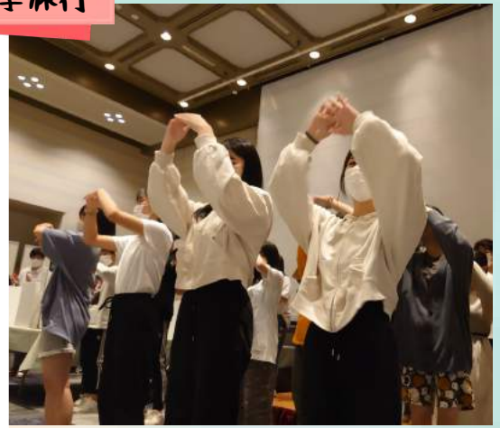
11月 淀フェス (体育祭の部)